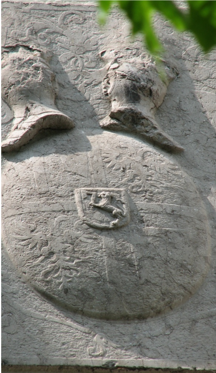
Tablica herbowa Tęczyńskich w wersji z 1561 r. na ścianie prezbiterium kościoła farnego w Końskowoli

się dwa topory i dwa dwugłowe orły cesarskie. Pamięć rycerskich czynach Andrzeja w czasie wojny z Turcją w 1532 r., jak również wola zjednania go dla polityki Habsburgów spowodowały, że cesarz Ferdynand I wydał 11 kwietnia 1561 r. ponowny patent hrabiowski, w którym udostępnił herb hrabiowski Tęczyńskich poprzez dodanie do tarczy w wersji z 1527 r. herbu sercowego z wyobrażeniem lwa (lamparta) trzymającego topór. O ile pierwszy przywilej cesarski rozciągał tytuł hrabiowski na cały ród Tęczyńskich, to akt z 1561 r. został wyraźnie ograniczony do Andrzeja Tęczyńskiego wojewody lubelskiego oraz jego dwóch synów – Jana i Andrzeja.