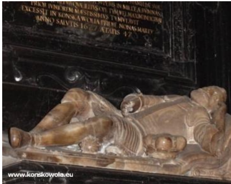
Fragment nagrobka księcia Krzysztofa Zbaraskiego. W pierwszej linijce od góry napis "excessit in Konska Wolia"